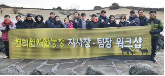
천리원체험농장 지사장·팀장 워크숍

양록업계에서 축산업부터 서비스업까지 제공하는 6차 산업은 천리원이 유일하다. 천리원은 사슴과 흑염소 사육 시설을 각각 체계적인 자동화시스템을 구축, 파인애플, 콩, 옥수수, 수단그라스, 소금, 사료 등 8~9가지의 천연재료를 섞어 15일 정도 숙성시켜 TMR사료를 직접 생산한다. 경기도 농업CEO 인증과 농업인 대상상을 받고 전국대 축산과, 식품공학부와 국가 공동연구사업으로 “사슴지표물질공동연구” 등 또한 강원대학교와 흑염소에 대한 연구를 준비 진행 중이며, 축산과학원 유전자원 연구소 명예 연구관을 8년 역임한 저력 있는